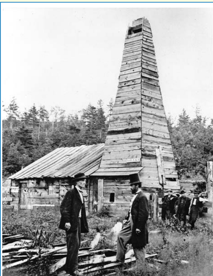
Edwin Drake (a destra) davanti alla prima torre di trivellazione (Drake Well Museum).

come sottoprodotto dell'estrazione del sale, cioè le sonde per estrarre il sale attraversavano gli strati del petrolio.