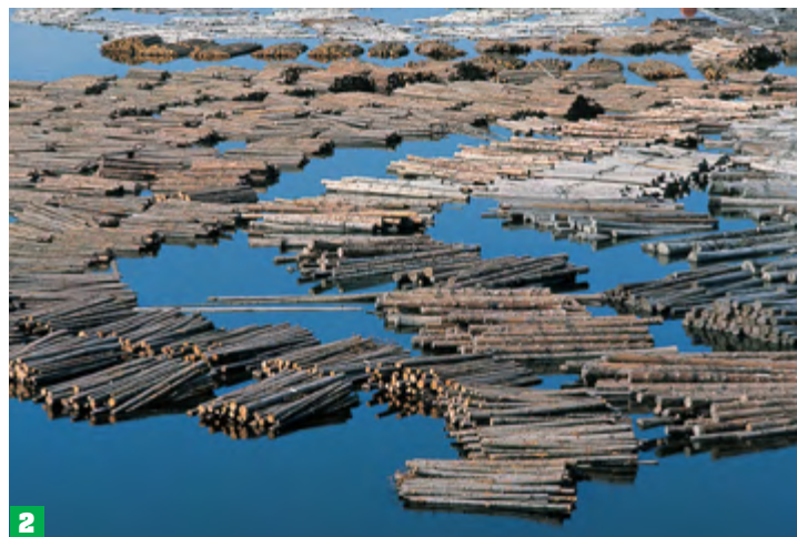
Tronchi riuniti in fasci, prima di essere trainati da rimorchiatori fino alle segherie attraverso le vie d'acqua interne.

La maggiore città è Stoccolma [1], la capitale, con circa 750 000 abitanti. Situata su alcune isole fra la costa baltica e