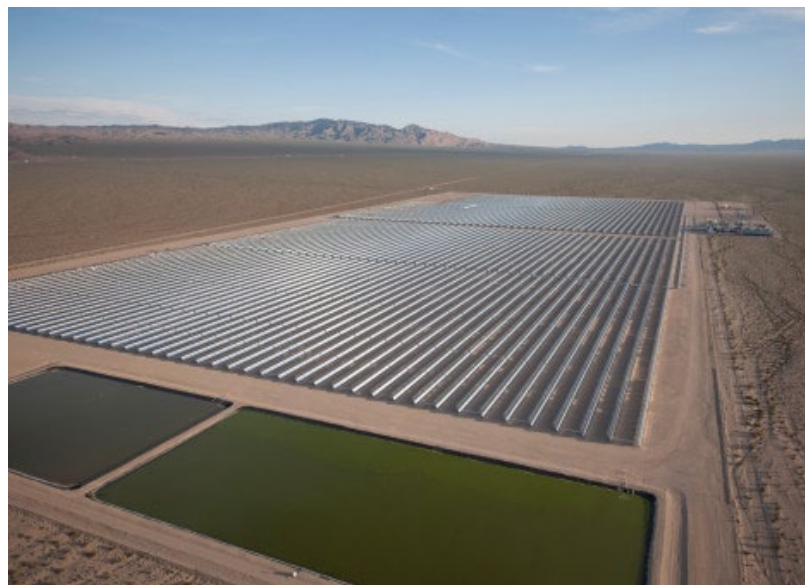
Figg. 3 e 4 Grandi specchi o 'collettori' concentrano la luce solare. Il calore viene usato per trasformare l'acqua in vapore, che muove turbine e produce elettricità.