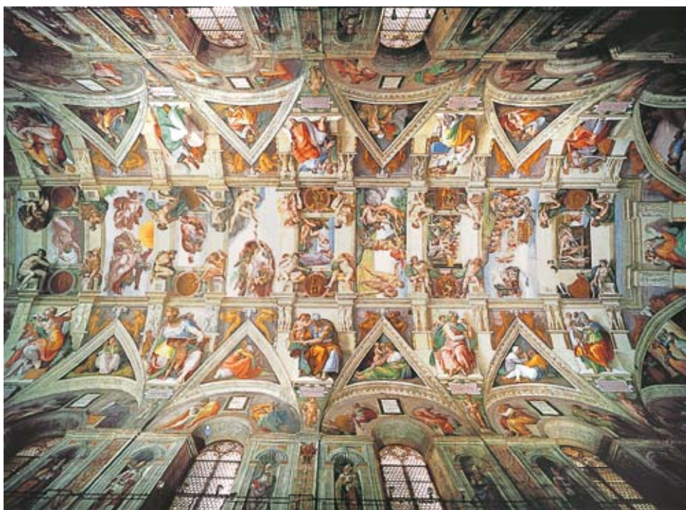
La Cappella Sistina nella Basilica di San Pietro.