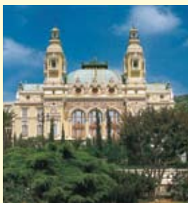
Il celebre casinò di Montecarlo.

Individua sulla carta il luogo e la posizione in cui sorgono gli edifici raffigurati nelle foto