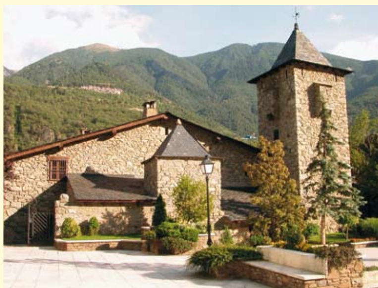
Casa de la Vall, sede del Parlamento di Andorra.

Una veduta di Monaco, capitale del Principato di Monaco.