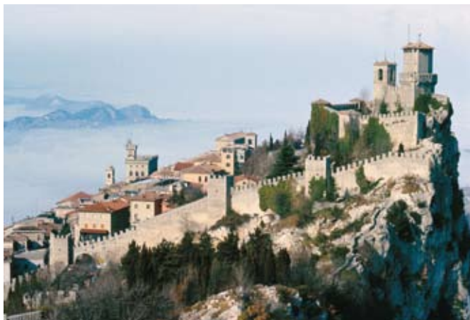
La rocca e le mura che circondano la città di San Marino.

Quali di queste caratteristiche è raffigurata nelle immagini?