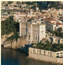
Il Museo Oceanografico di Monaco.