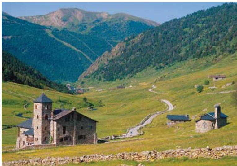
La Val d'Incles, Andorra.