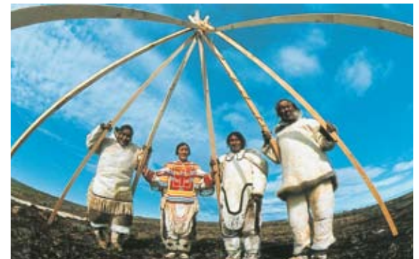
Inuit occupati nella costruzione di una capanna tradizionale di legno e pelle d'animale nella terra di Baffin.