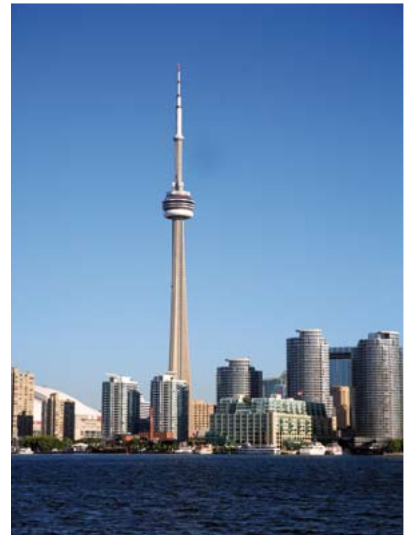
Lo skyline della principale metropoli canadese, Toronto, con la CN Tower.

► Diversamente dagli Usa, per molto tempo in Canada non è prevalso il principio del melting pot , la mescolanza dei gruppi etnici. Per decenni, anzi, si è imposta una politica di rigida distinzione fra le due principali comunità linguistiche : l'inglese (34% della popolazione) e la francese (23%). Quest'ultima, concentrata nel Quebec, sentendosi isolata in una terra prevalentemente anglosassone, ha sempre più accentuato le sue richieste di autonomia fino ad avanzare la proposta di secessione dal paese e di indipendenza politica; tale proposta non è stata però accettata dalla maggioranza degli abitanti della provincia. Negli ultimi decenni, tuttavia, l'arrivo di numerosi immigrati provenienti da diversi paesi europei (Italia soprattutto) e asiatici ha trasformato il Canada in uno stato multietnico in cui il 40% della popolazione non ha origine inglese o francese. Si calcola che oggi siano diffuse nel paese oltre 100 lingue e siano operanti mezzi di comunicazione di 40 lingue diverse. L'inglese e il francese restano comunque i due idiomi ufficiali del Canada. Le religioni più diffuse sono le protestanti cristiane (specie tra gli anglofoni), la cattolica (tra i francofoni) e l'animismo (tra i popoli indigeni).