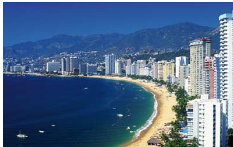
La spiaggia di Acapulco.