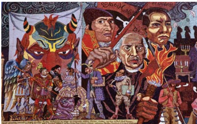
Un murale di Diego Rivera a Città del Messico: l'artista ha illustrato alcuni momenti della Rivoluzione messicana.