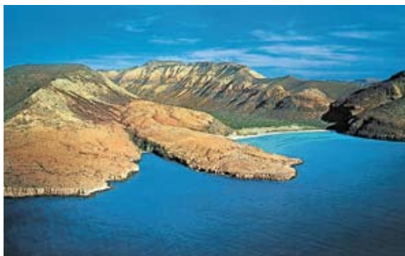
▲ L'arido paesaggio del Golfo di California.