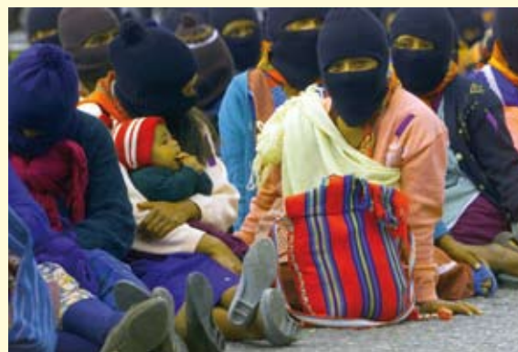
Un momento della marcia zapatista per la pace partita da San Cristóbal de las Casas nel 2001.

ebbe il levantamiento , l'insurrezione della popolazione indigena. Il primo gennaio l'EZLN invase per una notte e pacificamente molti centri abitati del Chiapas, fra cui anche la città di San Cristóbal de las Casas, dove il suo leader, il Subcomandante Marcos, lesse una dichiarazione in cui reclamava i diritti dei popoli indios. Gli occupanti si ritirarono il giorno dopo, ma questa azione fece conoscere al mondo le condizioni di vita e le ragioni delle popolazioni indigene. Nel 2001 è stata concessa l'autonomia alla regione.