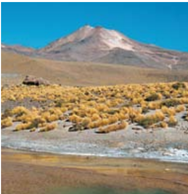
Il deserto di Atacama, nel Cile settentrionale.