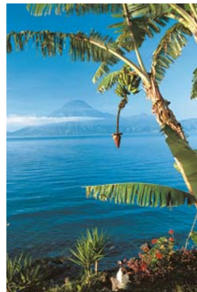
▲ Il lago di Atitlan, in Guatemala.