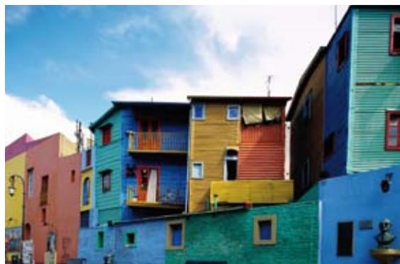
Il colorato quartiere della Boca a Buenos Aires.

Oggi 1/3 degli argentini è di origine italiana e a Buenos Aires intere zone sono abitate da discendenti di emigrati dal nostro paese. Tra queste, il pittoresco quartiere della Boca, dove i genovesi, che furono la prima comunità di italiani a stabilirsi in città, colorarono con tinte vivaci le facciate delle loro abitazioni. La maggior parte delle colonie italiane si trova nella provincia di Santa Fe , che alla laboriosità degli agricoltori piemontesi e lombardi deve il proprio sviluppo economico. Un gruppo di tessitori piemontesi, poi, diede vita a piccole aziende per la lavorazione della lana, e proprio da questi lanifici prese avvio l'industria tessile argentina nel Novecento. I nostri connazionali, però, non hanno portato in Argentina solo "braccia" per lavorare, ma anche la propria cultura : la creativi-