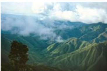
La Cordigliera centrale nelle Ande colombiane.