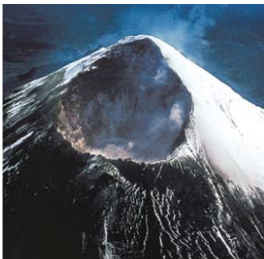
▲ La cima del vulcano Popocatepetl, in Messico.