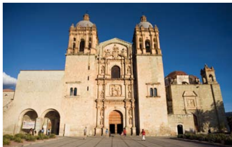
La Chiesa di san Domenico a Oaxaca, costruita tra la fine del XVI e l'inizio del XVII secolo e dedicata dai domenicani al fondatore del loro ordine Domenico di Guzmán.