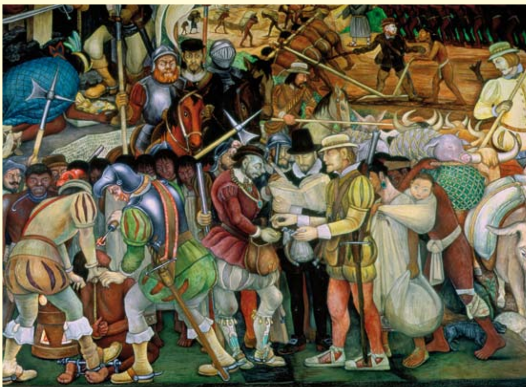
Lo sbarco di Hernán Cortés a Veracruz , in un dipinto di Diego Rivera del 1951. I conquistadores spagnoli distrussero l'impero azteco agli inizi del Cinquecento.

Leggi i testi e fai una ricerca sulle diverse interpretazioni che storici e intellettuali forniscono dell'impresa di Colombo e delle sue conseguenze, soffermandoti in particolar modo sulla questione indigena.