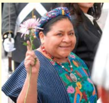
Rigoberta Menchú, leader del movimento per la difesa dei diritti civili in Guatemala.

Per indicare l'impresa compiuta da Cristoforo Colombo nel 1492 avrai sempre sentito usare l'espressione «scoperta delle Americhe». Oggi, però, il termine «scoperta» è considerato frutto di un punto di vista nettamente eurocentrico, quello cioè dei colonizzatori europei; così, molti storici e intellettuali, che si fanno interpreti delle ragioni delle civiltà «precolombiane» (preesistenti all'arrivo di Colombo), preferiscono parlare di «conquista» delle Americhe, ponendo l'accento sulle atroci violenze commesse dai colonizzatori.