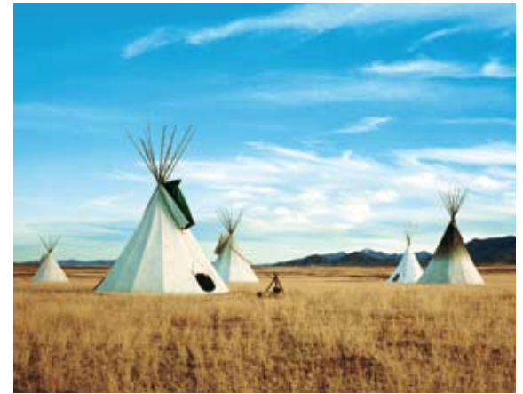
I tradizionali teepee, le tende dei pellirossa.