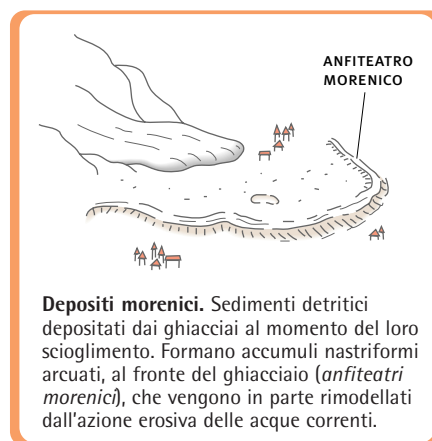
Depositi morenici. Sedimenti detritici depositati dai ghiacciai al momento del loro scioglimento. Formano accumuli nastriformi arcuati, al fronte del ghiacciaio ( anfiteatri morenici ), che vengono in parte rimodellati dall'azione erosiva delle acque correnti.

▶ depositi morenici lasciati dai ghiacciai in ritiro sbarrano il corso del fiume formando delle dighe naturali. È questo il caso dei grandi laghi prealpini: il Lago Maggiore, il Lago di Como, il Lago d'Iseo e il Lago di Garda. Il ghiacciaio del Lago di Como raccoglieva le nevi e i ghiacci della Valtellina, della Val Chiavenna e della Val Bregaglia. Si incanalava poi nell'attuale valle, dove si diramava in diverse direzioni, a formare i rami di Como e di Lecco, della Valsolda (Lago di Lugano) e della Valsassina. Allo sbocco in pianura i ghiacciai si allargavano in grandi lobi, alla terminazione dei quali venivano depositate le masse di detriti morenici. Al ritiro dei ghiacci i depositi morenici venivano abbandonati in semicerchi e oggi formano le colline della Brianza, la Franciacorta e i cordoni collinari del Garda.