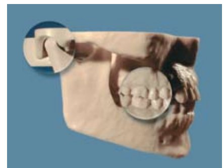
Occlusione in relazione centrica.

tale posizione si ripete per un breve istante nella deglutizione a vuoto (v. relazione centrica), essa si manifesta circa 800-1000 volte al giorno, quindi molto più frequentemente di quanto non si verifichi l'atto masticatorio.