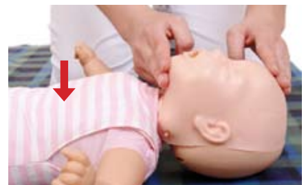
Si stacca la bocca: il torace si abbassa.