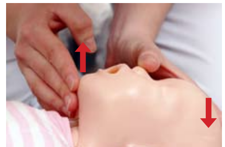
Iperestensione del capo.