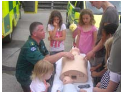
È importante imparare le tecniche di rianimazione attraverso un corso apposito.

Le immagini e le indicazioni di massima seguenti andranno quindi assolutamente integrate con la frequenza di un corso teorico-pratico eseguito sotto il controllo di personale qualificato.