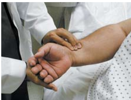
Il polso radiale si rileva sulla parte interna/superiore del polso.

Respirazione Artificiale e Massaggio Cardiaco Esterno sono di difficile realizzazione e, se eseguiti su un soggetto che non ne ha bisogno, possono causarne la morte.