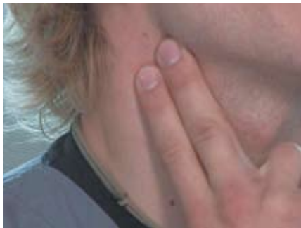
Il punto del collo in cui si rileva il polso carotideo (l'incavo posto sotto all'angolo della mandibola).

Prendere il polso significa rilevare le pulsazioni del cuore, cioè controllare che sia presente il battito cardiaco. Si possono individuare diverse sedi di polso, delle quali le principali sono il polso radiale e quello carotideo . Per verificare la presenza o meno del battito cardiaco il polso da rilevare è esclusivamente quello carotideo , che si controlla ponendo le dita lunghe sul collo dell'infortunato sotto all'angolo della mandibola, nella zona in cui passa l'arteria carotidea. In questa zona la presenza delle pulsazioni, oltre ad essere più attendibile, garantisce anche che il sangue riesce a raggiungere il cervello.