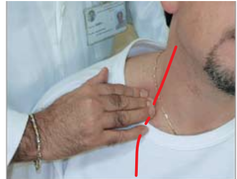
Emorragia della spalla Si comprime l'arteria succlavia.