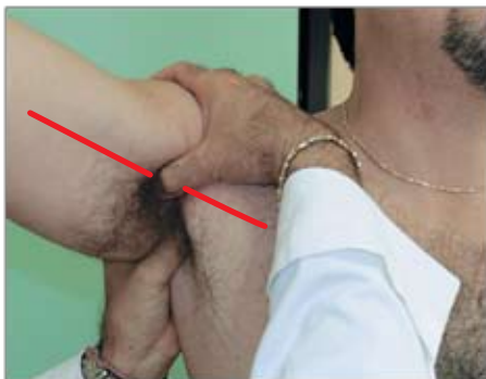
Emorragia del braccio (parte superiore) Si comprime l'arteria ascellare