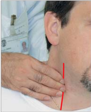
Emorragia del collo Si comprime la carotide.