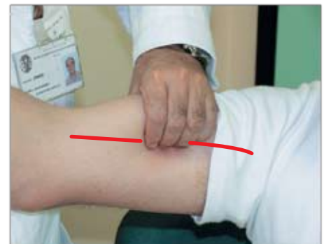
Emorragia del braccio (parte inferiore) Si comprime l'arteria omerale.