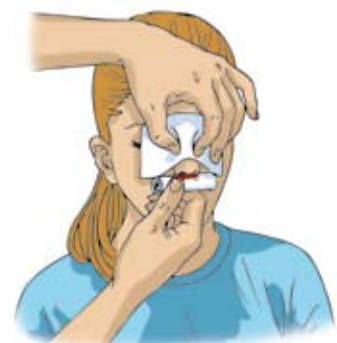
Manovra in caso di epistassi (sangue dal naso).