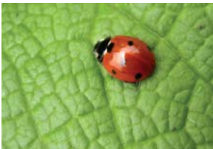
Le coccinelle, insetti "buoni", non vanno confuse con le cocciniglie, specie di insetti parassiti che danneggiano piante come l'olivo o gli agrumi.

L'esempio più conosciuto è quello della coccinella , un simpatico insetto dal caratteristico dorso rosso a puntini neri che si ciba degli afidi , piccoli parassiti che si nutrono succhiando la linfa delle piante e che vengono perciò detti "pidocchi delle piante". La presenza delle coccinelle protegge perciò le piante dagli afidi.