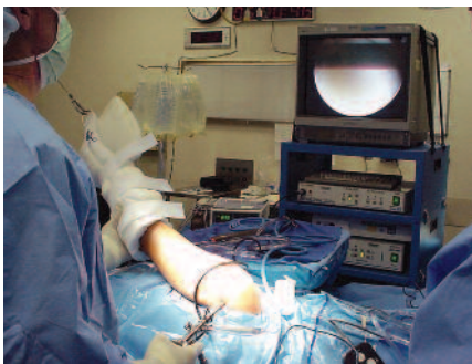
Un'operazione al ginocchio eseguita in artroscopia.

Con esami come la TAC o la RMN è possibile andare a esplorare l'interno delle articolazioni, evidenziando anche le strutture che non sarebbero visibili con una normale radiografia. In questo modo si riescono a vedere le lesioni di tendini, legamenti e menischi.