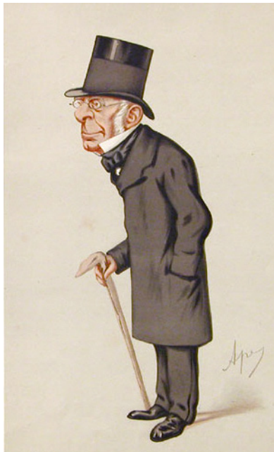
L'astronomo e matematico inglese Sir George Airy in una caricatura del 1875.

esso è deviato verso le montagne a causa dell'attrazione gravitazionale esercitata dalla loro massa. La deviazione che si osserva però è inferiore a quella che ci si aspetta considerando la massa della catena montuosa. Il fenomeno si spiega ammettendo che l'eccesso di massa dovuta al rilievo sia in parte compensato da una deficienza di massa nelle radici della catena. L'ispessimento della crosta continentale leggera, che sporge verso il basso entro materiali più densi, fornisce il supporto necessario per la spinta di galleggiamento, altrimenti le catene montuose non potrebbero rimanere elevate, ma sprofonderebbero lentamente nel mantello fino a raggiungere l'equilibrio isostatico.