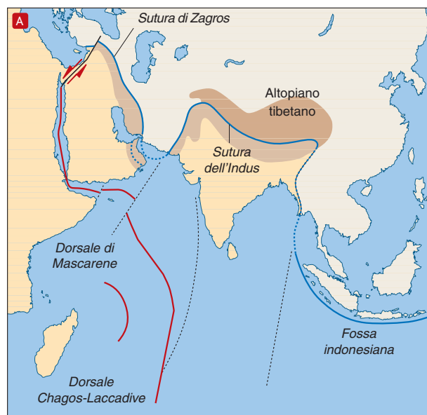
FIGURA 1 Lo scontro o aggancio del subcontinente indiano all'Asia e la conseguente formazione della catena himalayana sono un tipico esempio di collisione tra due blocchi continentali. (A) e (B), in origine, circa 70÷80 milioni di anni fa (Cretaceo), l'India si trovava molto più a sud, vicino al Madagascar, ma abbastanza velocemente ha cominciato a essere trascinata verso nord, dove, ai margini dell'Asia, una zona di subduzione inghiottiva la crosta oceanica della Tetide. Così, intorno a 60÷40 milioni di anni fa (Eocene), il subcontinente indiano entrò in collisione con l'Asia e si formò la grande catena montuosa dell'Himalaya.