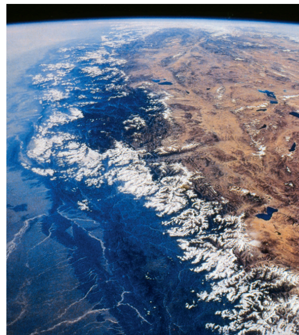
FIGURA 2 La catena himalayana vista da satellite.