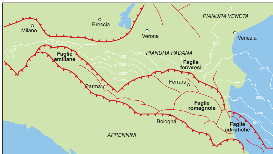
FIGURA 3 Presenza del fronte appenninico nel sottosuolo emiliano. Sono indicati gli archi di accavallamenti denominati rispettivamente arco emiliano, arco ferrarese e arco romagnolo-adriatico.

Mar Tirreno con conseguente deriva dell'«Italia» verso est e la messa in posto finale degli Appennini. Il movimento di apertura del Tirreno è in atto anche oggi e quindi anche la catena appenninica è sotto stress andando essa ad accavallarsi su Adria (figura 4). Quindi, in definitiva, il terremoto dell'Emilia è il risultato dell'accavallamento del fronte appenninico su Adria, movimento causato dall'apertura del bacino tirrenico.