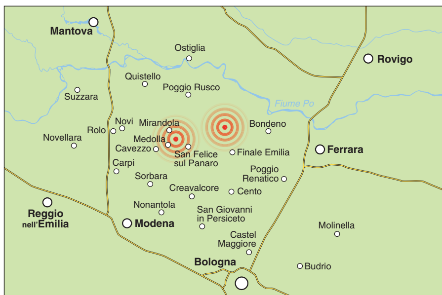
FIGURA 1 Localizzazione dei due epicentri dei terremoti avvenuti in Emilia il 20 e il 29 maggio 2012.

I l terremoto verificatosi nel maggio 2012 è un evento sismico costituito da una serie di scosse localizzate nella pianura padano-emiliana, prevalentemente nelle province di Modena, Ferrara, Mantova, Reggio-Emilia, Bologna e Rovigo. La scossa più forte, di magnitudo 5,9, è stata registrata il 20 maggio 2012 alle ore 04:03:52 ora italiana con epicentro a Finale Emilia (figura 1) a una profondità di 6,3 chilometri. Il 29 maggio, alle 09:00:00 una nuova e forte scossa di magnitudo 5,8 si è verificata con epicentro situato nella zona compresa fra Mirandola, Medolla e San Felice sul Panaro. Altre importanti scosse si sono verificate il 31 maggio con epicentro a Rolo e Novi di Modena. Queste scosse principali sono state seguite da uno sciame sismico con scosse via via di minore entità.