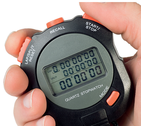
FIGURA 3 Un display a cristalli liquidi.