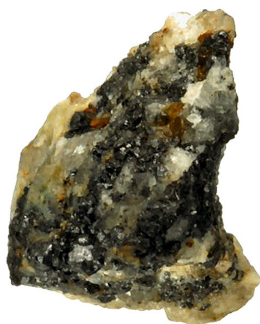
FIGURA 1 Il primo quasicristallo di origine naturale è stato individuato in questo campione di roccia triassica.

Lo studio dello stato solido ha messo in discussione alcuni dogmi della mineralogia, ma ha posto le basi per la ricerca di nuovi materiali e delle loro possibili applicazioni in campo tecnologico.