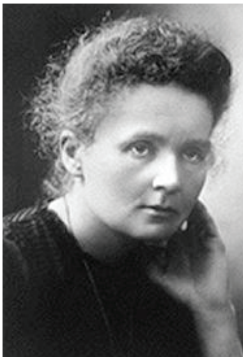
◀ Figura 1 Marie Curie.

In onore di Marie Curie (e di suo marito Pierre), all'elemento con numero atomico 96 fu assegnato il nome curio (Cm); inoltre una delle unità di misura della radioattività è il curie (Ci), oggi sostituita nel Sistema Internazionale dal Becquerel (Bq).