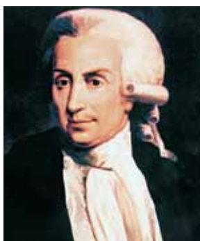
■ Luigi Galvani