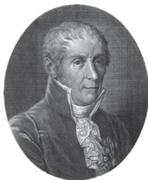
■ Alessandro Volta