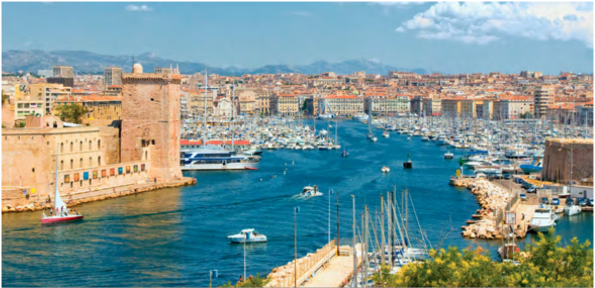
3 Il vecchio porto di Marsiglia

La seconda città come numero di abitanti è Marsiglia (1,3 milioni) (figura 3): si affaccia sul Mediterraneo, dove costituisce il più importante porto francese per traffico di merci e passeggeri, e un grande scalo petrolifero; è anche meta turistica perché conserva importanti tesori d'arte. La terza città è Lione (1,3 milioni di ab.): situata alla confluenza della Saona nel Rodano, vanta origini romane di cui conserva l'anfiteatro augusteo; è un centro industriale e finanziario in grande espansione. Altre importanti città sono Tolosa, dove sono localizzate imprese aerospaziali, istituti di ricerca e due università a carattere essenzialmente scientifico; Nizza, città della Costa Azzurra, centro turistico e culturale; Strasburgo, porto fluviale sul Reno al confine con la Germania, sede del Parlamento europeo, del Consiglio d'Europa e della Corte internazionale dei diritti dell'uomo.