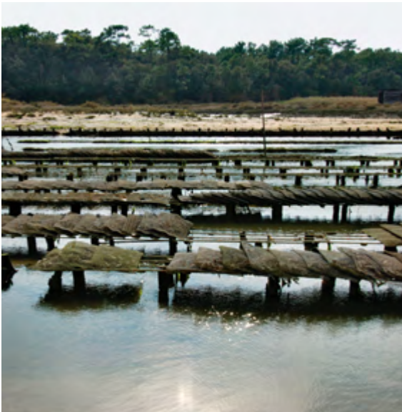
6 Allevamento di ostriche sulla costa atlantica