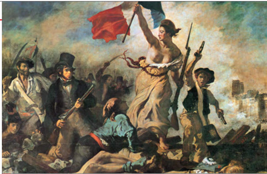
2 Dipinto di Delacroix in memoria della Rivoluzione francese

Fin dall'inizio la Francia ha svolto un ruolo importante nello sviluppo dell'Unione europea, nell'ambito della quale è uno dei paesi più avanzati.