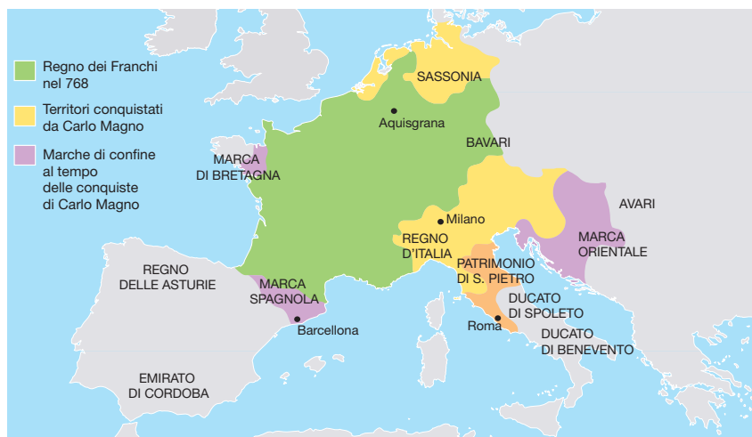
1 L'espansione dei franchi durante la dinastia carolingia

Durante la Prima guerra mondiale, la Francia, legata a Inghilterra e Russia dalla Triplice Intesa, riuscì a bloccare l'esercito tedesco prima che raggiungesse Parigi (battaglia della Marna). Allo scoppio della Seconda guerra mondiale, l'esercito si mobilitò lentamente, consentendo alle truppe tedesche di giungere a Parigi in brevissimo tempo. La parte settentrionale del paese venne occupata direttamente dai tedeschi, mentre a sud fu insediato un governo collaborazionista con a capo il maresciallo Pétain (Repubblica di Vichy). Durante gli anni dell'occupazione tedesca, molti patrioti francesi parteciparono alla Resistenza, grazie anche al coordinamento da Londra del generale De Gaulle. Nel 1944, poi, lo sbarco degli Alleati in