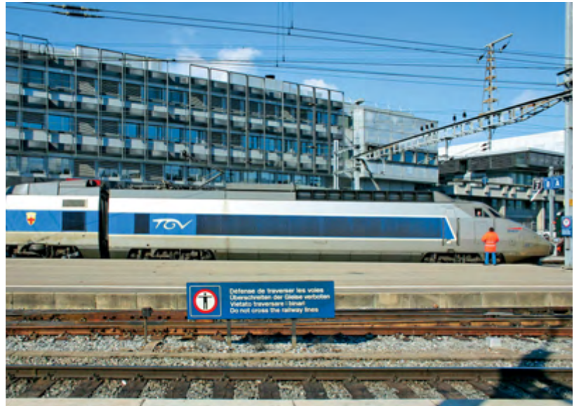
7 Il TGV