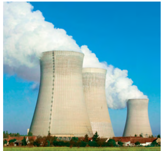
4 La centrale nucleare di Dampierre

L' industria francese trae l'energia necessaria dalle centrali nucleari (circa 20) (figura 4), dislocate lungo i grandi fiumi e i litorali marini. È in crescita anche la produzione di energia idroelettrica. Numerosi impianti petrolchimici per la raffinazione dei prodotti petroliferi importati sono dislocati nei pressi dei porti marittimi e fluviali. Gasdotti e oleo-