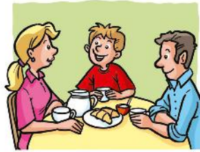
a. | 1 |