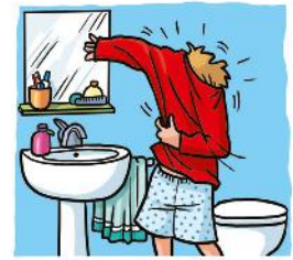
d. | ..... |