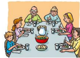
e. | ..... |