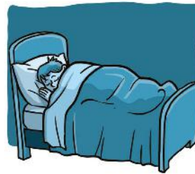
c. | ..... |