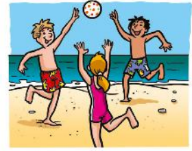
b. | ..... |