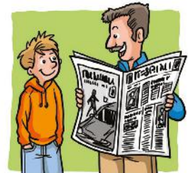
f. | ..... |

7 Completa con la descrizione della tua domenica. Aiutati con il lessico a lato.