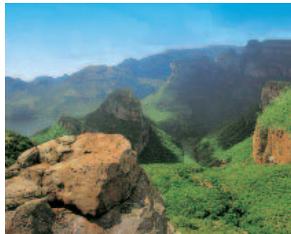
1 I Monti dei Draghi in Sudafrica.