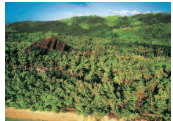
4 La foresta del Madagascar orientale.