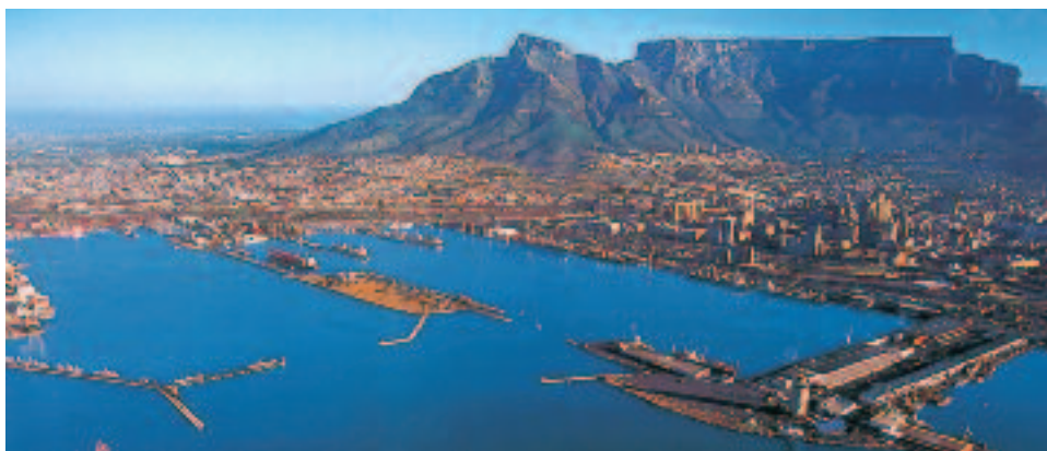
3 Città del Capo con, sullo sfondo, il Monte della Tavola.