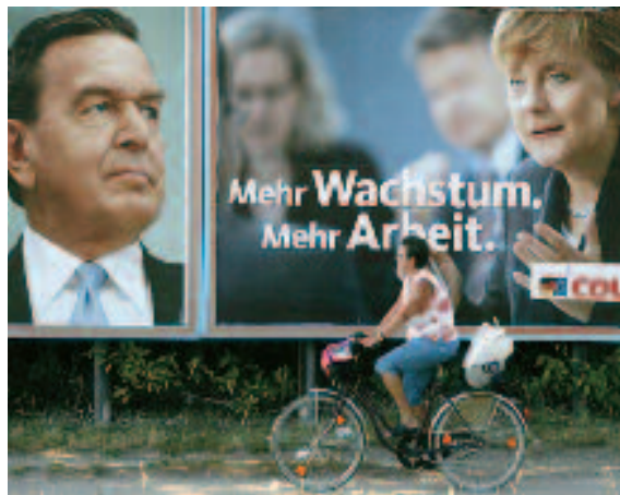
Campagna elettorale per le elezioni politiche in Germania.