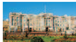
Buckingham Palace, principale residenza della famiglia reale.