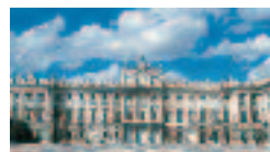
Escorial, sede della monarchia spagnola.