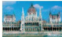
Il palazzo del Parlamento a Budapest, sulle rive del Danubio.