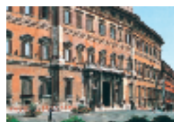
Palazzo Montecitorio a Roma, sede della Camera dei deputati.

Inserisci nella carta che rappresenta monarchie e repubbliche europee il nome degli stati mancanti: Francia, Spagna, Norvegia, Slovenia, Grecia, Russia, Portogallo, Slovacchia, Croazia, Bielorussia. Osserva quindi le foto raffiguranti regge e palazzi presidenziali europei e indica in quale stato si trovano.