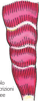
muscolo con iscrizioni tendinee