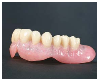
protesi mobile completa