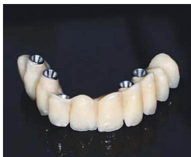
protesi a supporto implantare