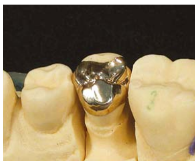
corona tre quarti