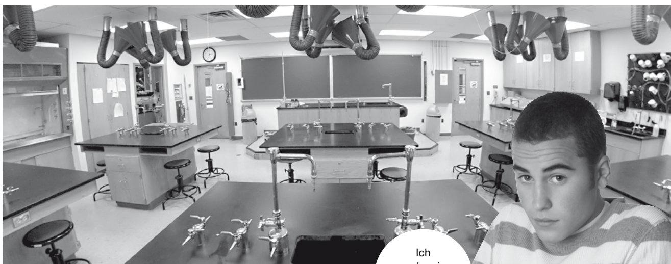
Ich und mein Chemielabor.