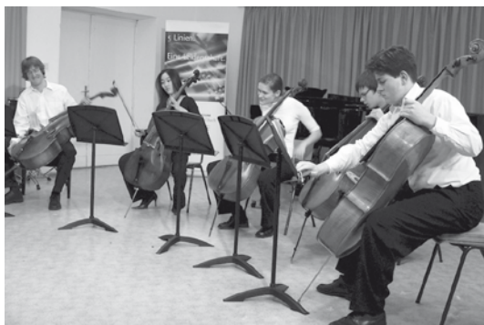
Schule für Konzertmusiker www.musikgymnasium-berlin.de