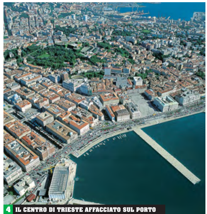
4 IL CENTRO DI TRIESTE AFFACCIATO SUL PORTO