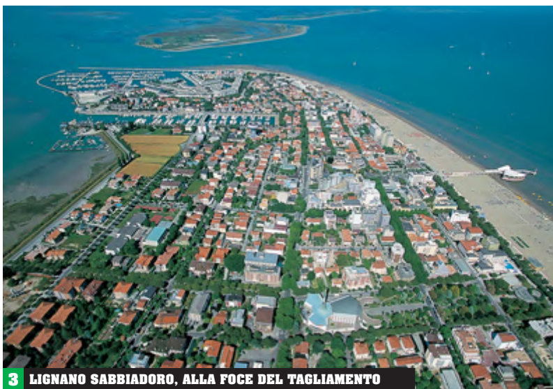
3 LIGNANO SABBIAORO, ALLA FOCE DEL TAGLIAMENTO

La pianura friulana [2] rappresenta l'estrema propaggine della Pianura Padano-Veneta. Si estende dalla metà della regione fino al Mare Adriatico. È attraversata da nord a sud da numerosi corsi d'acqua.