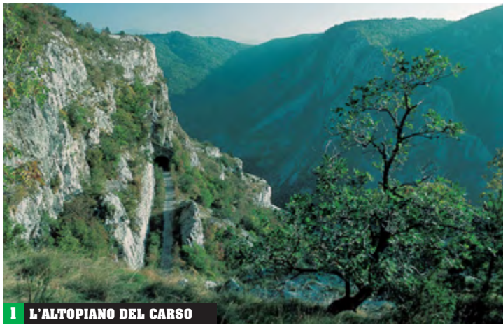
1 L'ALTOPIANO DEL CARSO