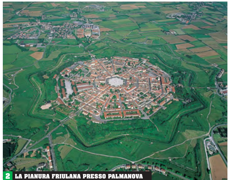
2 LA PIANURA FRIULANA PRESSO PALMANOVA