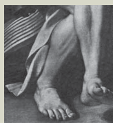
← Caravaggio, San Matteo e l'Angelo , 1601 ca. Olio su tela. Roma, Chiesa di San Luigi dei Francesi, Cappella Contarelli.