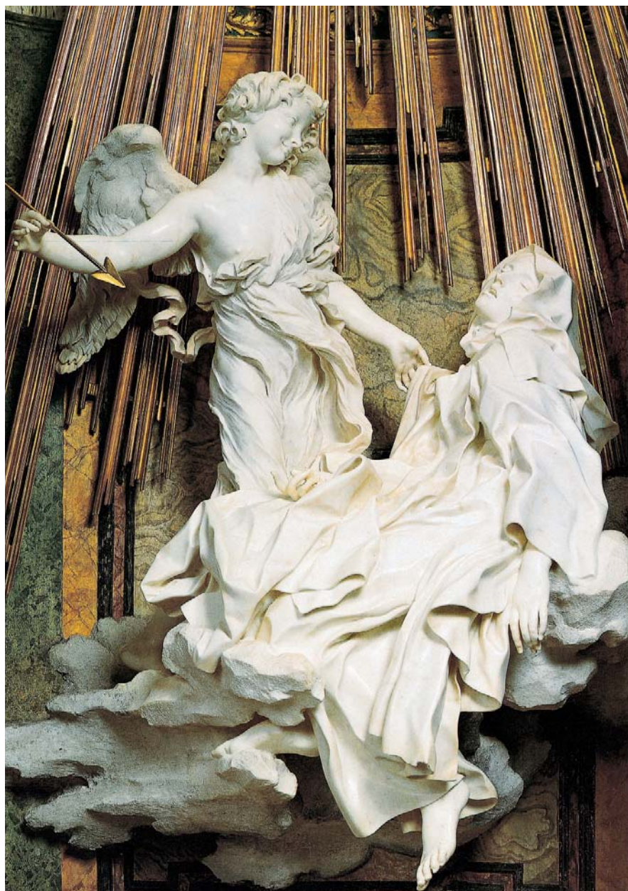
↑ Gian Lorenzo Bernini, Estasi di Santa Teresa , 1647-1652 ca. Roma, Santa Maria della Vittoria, Cappella Cornaro.