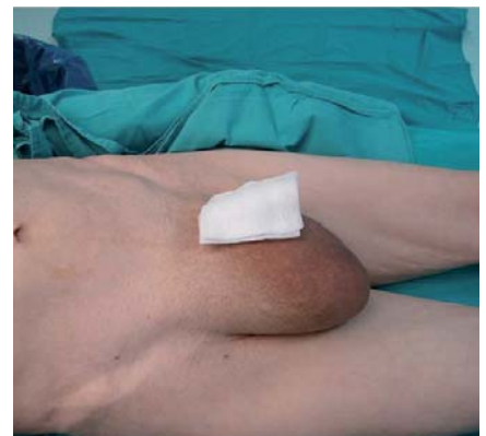
L'ernia inguinale può causare un grande rigonfiamento a livello dell'inguine.