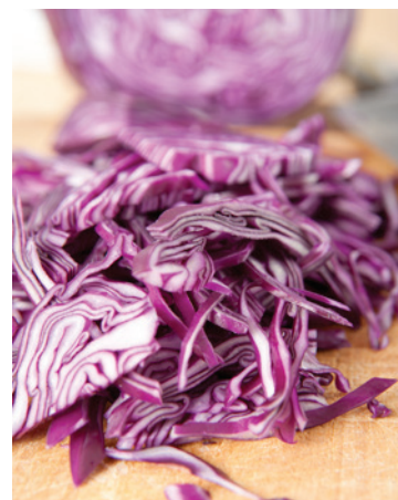
▲ Figura 1 Facendo bollire per trenta minuti circa un po' di cavolo rosso, tagliato a fette e coperto di acqua, si ottiene una soluzione intensamente colorata in blu che funge da indicatore acido-base. Essa assume una colorazione verde in ambiente basico e una colorazione rossa in ambiente acido.

Nel corso della titolazione il pH aumenta in modo netto soltanto in prossimità del cosiddetto punto equivalente , cioè la situazione in cui la quantità di base aggiunta è stechiometricamente uguale a quella dell'acido.