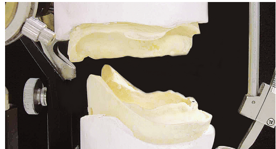
Classe III di Ackermann