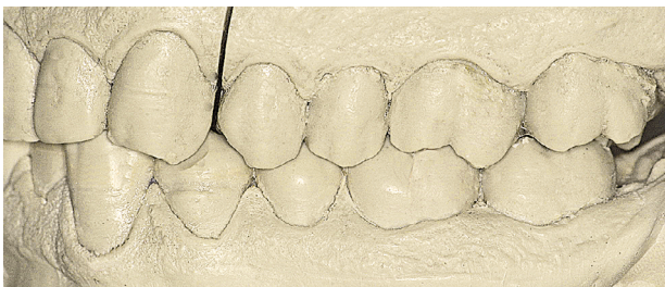
Intercuspiazione dente a due denti