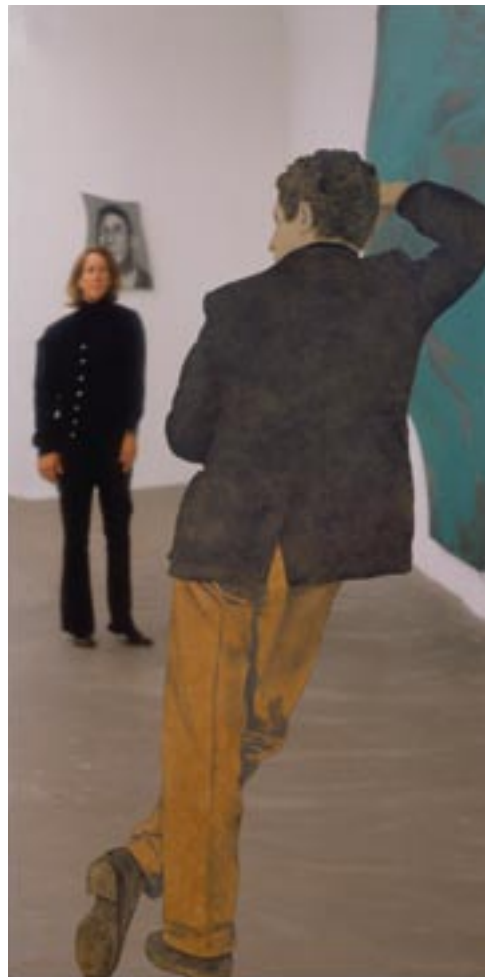
← Michelangelo Pistoletto, Uomo coi pantaloni gialli , 1964. Museum of Modern Art, New York.

È uno dei primi lavori su "specchio" che caratterizzano, a partire dagli anni Sessanta, tutta la carriera artistica di Pistoletto. La fotografia di un uomo, ingrandita a dimensioni reali, viene ricalcata a punta di pennello su carta velina e ritagliata lungo i contorni per ottenere un effetto più realistico. L'immagine così acquisita viene applicata su una lastra di acciaio inox lucidato a specchio. Questo tipo di opera realizza l'antico ideale di una pittura capace di doppiare perfettamente la realtà, ma riesce ad andare anche oltre, inglobando all'interno dello spazio dell'opera la vita stessa: tutto ciò che viene a specchiarsi nel quadro, infatti, dall'ambiente allo spettatore, entra a far parte dell'opera. Lo spazio chiuso del dipinto si apre allo spazio multiforme della realtà e il pubblico si trova coinvolto nel ruolo di spettatore-attore come è possibile vedere in Uomo coi pantaloni gialli del 1964.