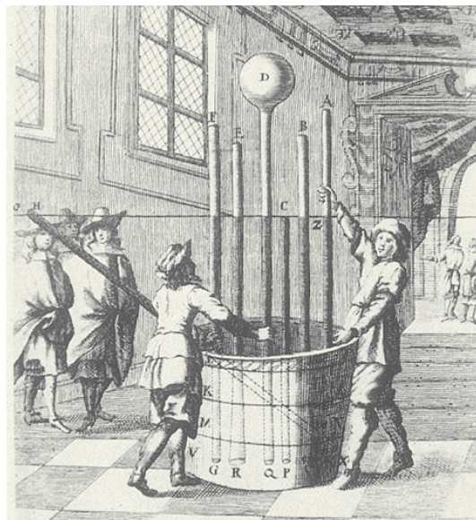
Esperimento dell'ascesa del liquido nei tubi torricelliani.