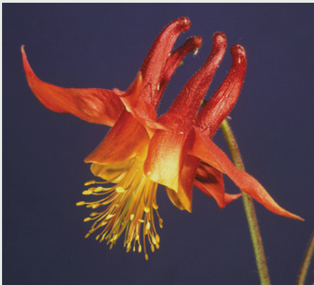
(A) Aquilegia formosa

formosa , le falene continuano a visitare prevalentemente A. pubescens (►figura C), forse a causa del colore della luce riflessa dai fiori delle due specie, che è molto diverso. Di conseguenza queste due specie, sebbene siano interfeconde, raramente formano ibridi in natura, perché attraggono impollinatori diversi.