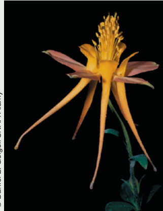
(B) Aquilegia pubescens