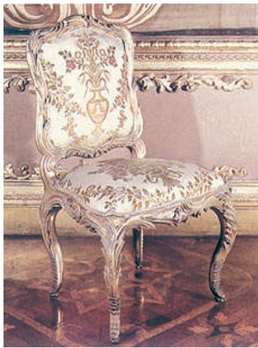
Sedia settecentesca del Palazzo Reale di Torino.

Il Settecento fu l'epoca della trionfante moda del Rococò , che segnò di sé tutte le produzioni artistiche e artigianali. Le forme sinuose ed elaborate dettate da questa moda costringevano gli artigiani del legno a una enormità di sprechi, cesellature, intagli, incastri, tanto da rendere questi prodotti irraggiungibili dalle borse della nascente borghesia. Il crollo economico dell'aristocrazia impose agli artigiani la conciliazione del gusto con le esigenze economiche.