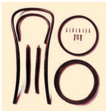
La sedia n. 14 smontata.

A questo ex artigiano austriaco spetta il merito di aver saputo fare una sintesi tra le diverse esigenze confluenti. A lui spetta, inoltre il ruolo di primo vero «designer» dell'era industriale. Eliminando ogni margine di incidenza dell'operaio sulla forma dell'oggetto, aveva dato un potere decisionale totale al progettista che, da solo, era delegato a compiere una sintesi formale in linea con le esigenze tecniche e di mercato. È da notare che nella migliore produzione Thonet trovano soluzioni anche esigenze fino ad