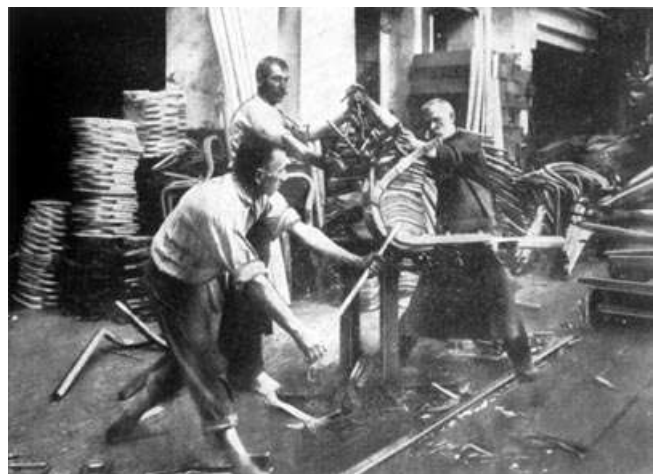
Piegatura dei listelli nella fabbrica Thonet (inizi del '900). I listelli estratti dall'autoclave, in cui hanno assorbito umidità, vengono piegati a forza nelle forme metalliche e fissati con morsetti, per poi essere essiccati nei forni.

Si trattava insomma di un vero e proprio processo industriale. La graduale eliminazione di ornamenti e incastri, a favore di una linea rigorosa e curata e di giunzioni semplici (tramite viti, filettature sul legno, ecc.) completarono il quadro per il successo dei suoi prodotti.