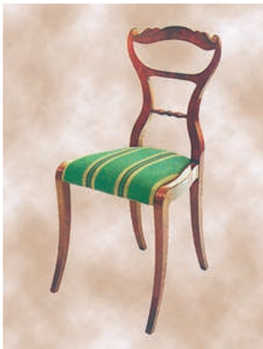
Sedia in stile Biedermeier (circa 1830). Dall'inizio dell'800 vengono prodotti per la borghesia mobili di stile più sobrio, come lo stile Biedermeier, ma realizzati con tecniche di lavorazione tradizionale.