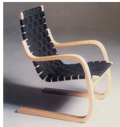
Poltrona «406» di Alvar Aalto (1935).

Scegliendo la poltroncina B9 di Thonet per il padiglione dell' Esprit Nouveau del 1925, Le Corbusier si esprime così: «Abbiamo scelto la seggiola umile di Thonet in faggio piegato, certamente la più comune e la più economica, perché pensiamo che questo modello, del quale milioni di esemplari sono usati nel Continente e nelle due Americhe, possiede una sua nobiltà».