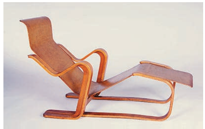
Sdraio «Isokon» di Marcel Breuer (1936).

Esprit Nouveau: denominazione originariamente coniata da Le Corbusier per il movimento razionalista.