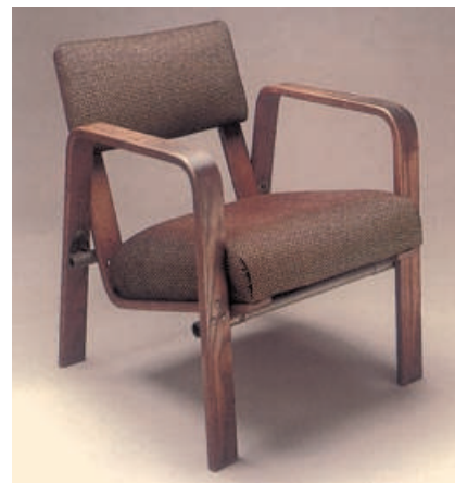
Poltrona «ti 242» di Josef Albers (1929).

Altri designer, quali lo scandinavo Alvar Aalto, seppero interpretare in modo originale la tecnologia del legno curvato, recuperando tradizioni locali (l'uso della betulla) e proponendo prodotti di qualità ancor oggi di successo.