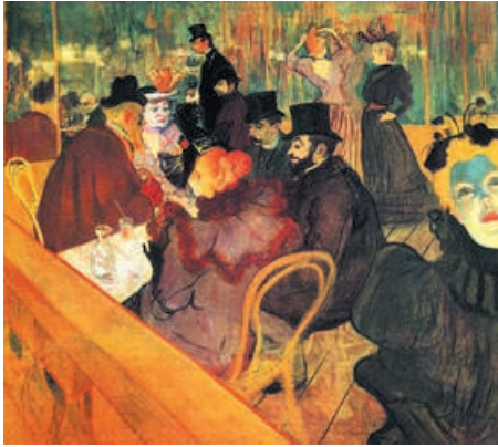
Al Moulin Rouge di H. Toulouse Lautrec (1892). Le sedie Thonet sono ormai diffuse in tutti gli ambienti pubblici e privati.

Dal 1853 l'azienda di Thonet conobbe un'esplosione commerciale tale che alla fine del secolo essa occupava 6.000 dipendenti, con una produzione di 4.000 pezzi giornalieri. Nata nel 1859, la famosa sedia n. 14, nel 1911, era già stata riprodotta in 50 milioni di esemplari.