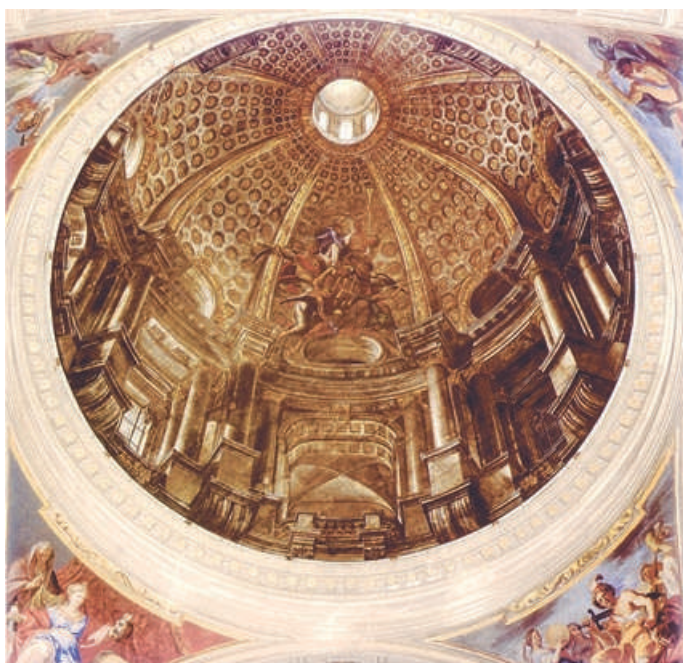
Finta cupola nella Chiesa di S. Ignazio a Roma di Andrea Pozzo (1694).

di Andrea Pozzo nella Chiesa di S. Ignazio a Roma, gli affreschi di Paolo Veronese (1528-1588).