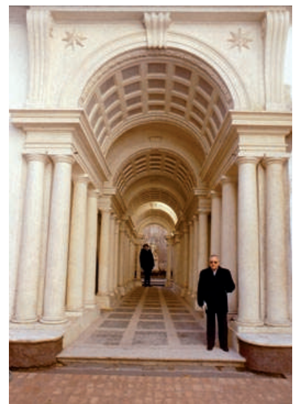
Galleria prospettica di Palazzo Spada a Roma di Francesco Borromini (1652). L'effetto di profondità e della volta, oltre che dalla convergenza delle pareti laterali; le reali dimensioni sono disvelate da riferimenti (persone disposte alle estremità).