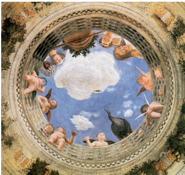
Volta della Camera degli sposi (1465 - 1474) nel Palazzo Ducale di Mantova, opera di Andrea Mantegna.

Quest'ultimo ci lasciò il primo vero dipinto illusionistico su volta nella Camera degli sposi nel Palazzo Ducale di Mantova;