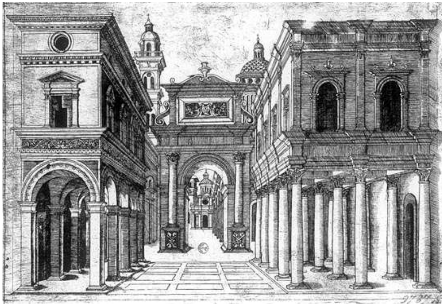
Disegno prospettico di Scena teatrale , di Donato Bramante (1475).

Alle scenografie prospettiche si dedicò gran parte degli architetti e scenografi del Rinascimento e del Barocco. I meravigliosi progressi della prospettiva divennero un elemento tecnico che l'arte, in particolare quella barocca, asservì alle proprie esigenze di creazioni fantastiche e monumentali, capaci di incantare ed emozionare. Tra il Cinquecento e il Seicento i maestri della prospettiva hanno lasciato grandi opere di un illusionismo pittorico stupefacente; dal lungo elenco si possono ricordare le scenografie di Ferdinando Galli da Bibiena, la volta e la finta cupola