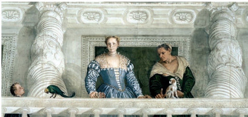
Affresco nella Sala dell'Olimpo, a Villa Barbaro (Masèr, Treviso), opera di Paolo Veronese (1560).