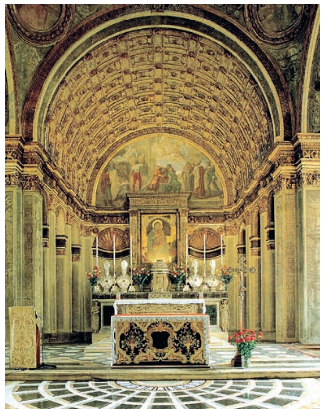
Finto coro nella Chiesa di S. Maria presso S. Satiro a Milano, opera di Donato Bramante (1486 circa).