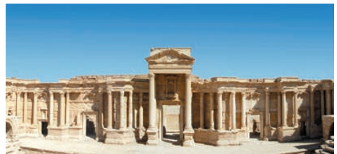
Scena del teatro romano di Palmira (III sec. d.C.)