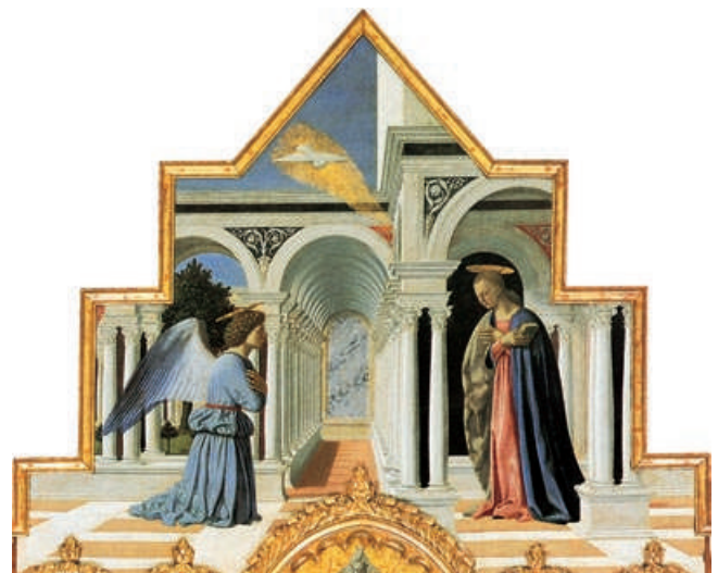
Annunciazione sul Polittico di S. Antonio , opera di Piero della Francesca (1468). L'impianto simmetrico accentua l'aura di sereno misticismo, appena attenuata dalla fuga prospettica del portico centrale.