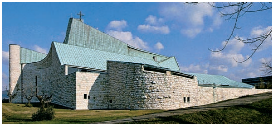
Chiesa di S. Giovanni Battista, a Firenze di Giovanni Michelucci (1964). L'impianto libero e le superfici curve creano effetti fortemente dinamici.