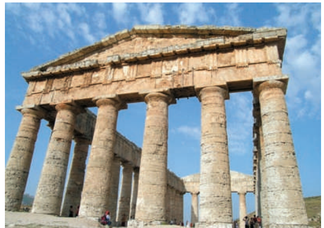
Fronte del tempio greco di Segesta (V sec. a.C.)

La simmetria rispetto a un asse o rispetto a un piano infondeva la sensazione di un'armonia equilibrata e calma; per questo motivo il suo impiego è stato prevalente in opere o monumenti rappresentativi di un ordine sociale o religioso. I templi, i dipinti di argomento religioso, i palazzi del potere hanno avuto in genere un impianto simmetrico.