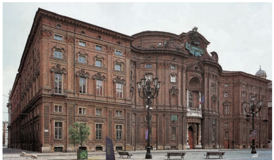
Palazzo Carignano, a Torino, opera di Guarino Guarini (1685). La facciata simmetrica è animata da una alternanza di superfici piane e concavo-convesse.