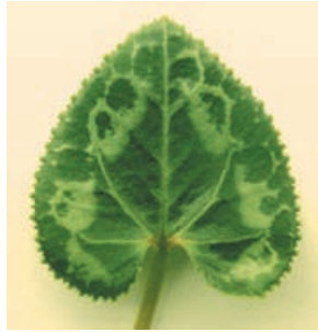
Animali e vegetali presentano quasi sempre una simmetria assiale.

Tra i diversi tipi di simmetria è sempre stata particolarmente prediletta la simmetria assiale , perché riscontrabile sul corpo umano e su gran parte degli esseri viventi.