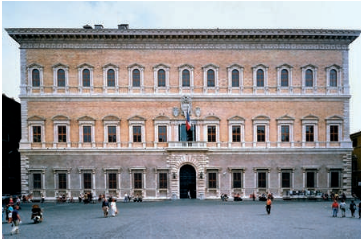
Palazzo Farnese, a Roma, opera di Antonio da Sangallo e Michelangelo (1515). La facciata del palazzo funge da sfondo a una strada; la sua simmetria ne accentua il ruolo di statico terminale di un percorso.