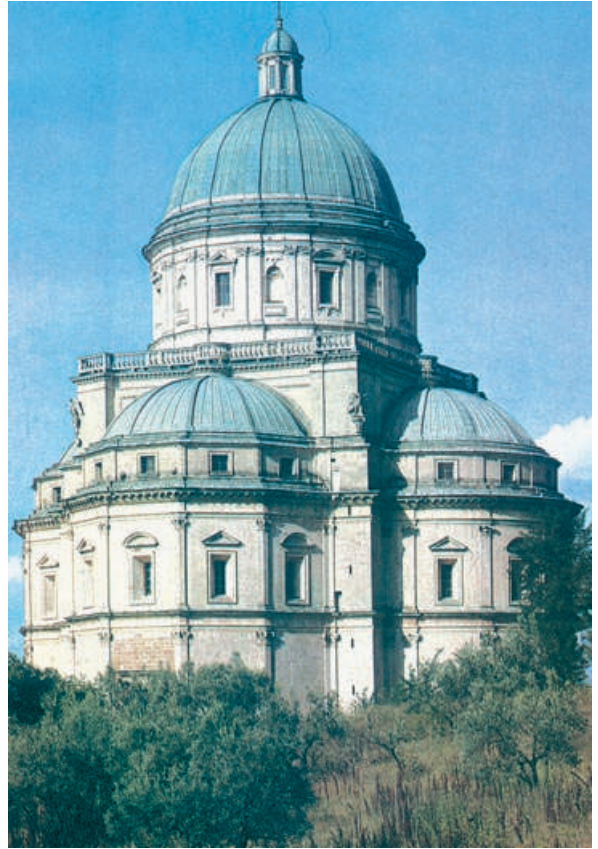
Chiesa di S. Maria della Consolazione, a Todi, di Cola da Caprarola (1508). L'impianto dell'edificio presenta volumi regolari ed equilibrati su due piani di simmetria

Talvolta essa sopravvisse, con effetti molto attenuati da superfici curve ed effetti dinamici e luminosi, come nell'arte barocca; in altri casi, come nell'arte contemporanea, tende a scomparire.