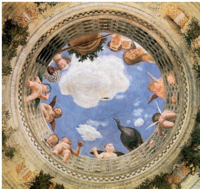
Volta della Camera degli sposi (1465 - 1474) nel Palazzo Ducale di Mantova, opera di Andrea Mantegna.

Quest'ultimo ci lasciò il primo vero dipinto illusionistico su volta nella Camera degli sposi nel Palazzo Ducale di Mantova;