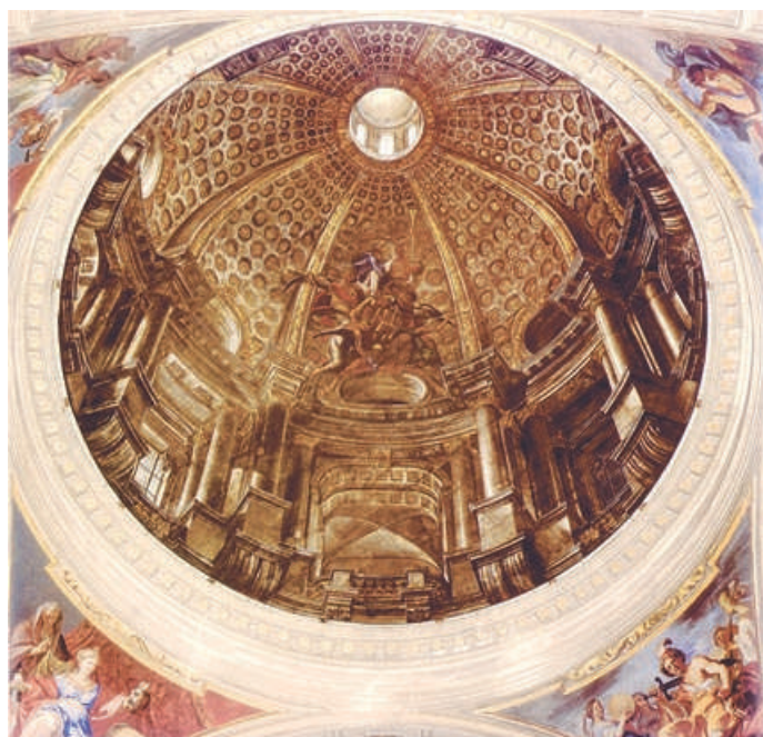
Finta cupola nella Chiesa di S. Ignazio a Roma di Andrea Pozzo (1694).

di Andrea Pozzo nella Chiesa di S. Ignazio a Roma, gli affreschi di Paolo Veronese (1528-1588).