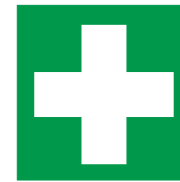
Cassetta primo soccorso