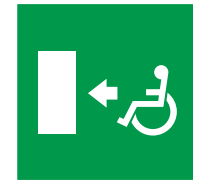
Percorso per l'uscita di emergenza per disabili