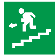
Scala di emergenza