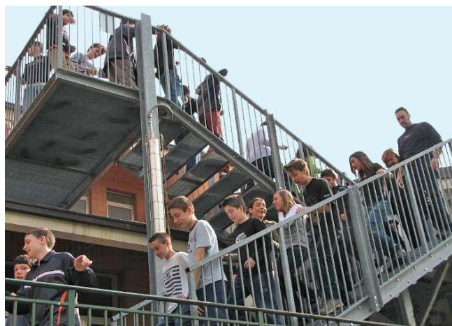
Esercitazione di evacuazione.

Almeno due volte l'anno nella scuola devono essere attuate esercitazioni di evacuazione , per verificare l'apprendimento delle procedure e dei comportamenti previsti dal piano di evacuazione. Al termine dell'esercitazione, all'interno della scuola e delle singole classi, vengono analizzati comportamenti, disfunzioni o errori al fine di correggerli.