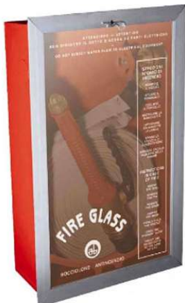
Cassetta per idrante.