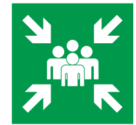
Punto di raccolta