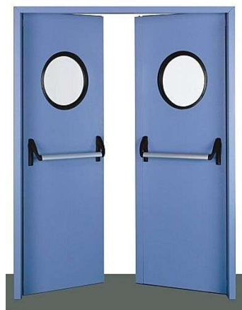
Porta di emergenza con maniglioni antipanico.