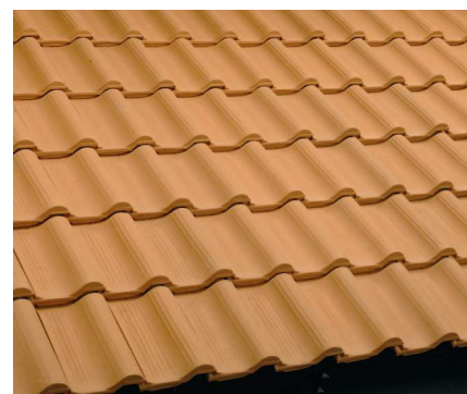
Copertura con tegole olandesi.

• pezzi speciali : per sopperire alla difficile geometria e conformazione dei tetti spioventi.