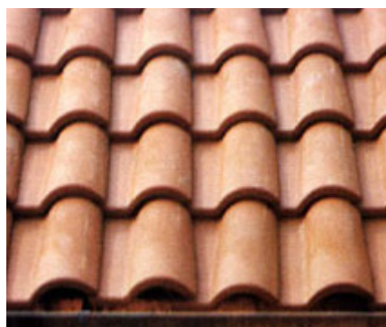
Copertura con tegole portoghesi.

La parte superiore si restringe e presenta dei rilievi per gli incastrici reciproci;