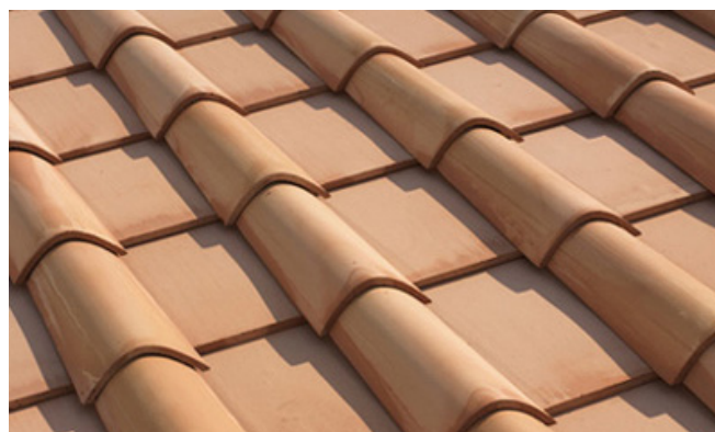
Tetto coppi su embrici.