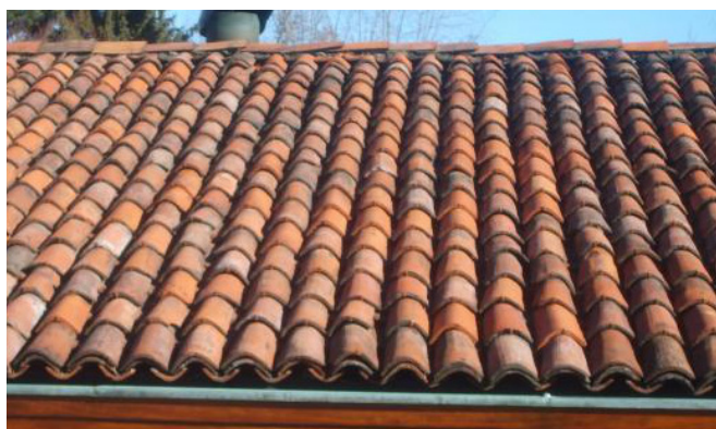
Tetto coppi su coppi.