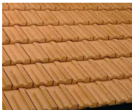
Copertura con tegole marsigliesi.

• tegole marsigliesi : di forma piana rettangolare (25 × 40 cm) con nervature caratteristiche a solchi superiori e sagomature perimetrali (dentelli) che facilitano l'incaastro con altre tegole;