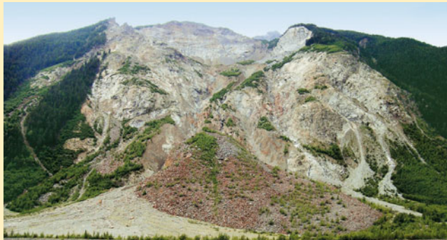
Frana; Valtellina; rischio idrogeologico