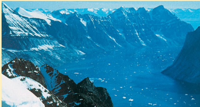
Fiordo; Groenlandia; glaciazione