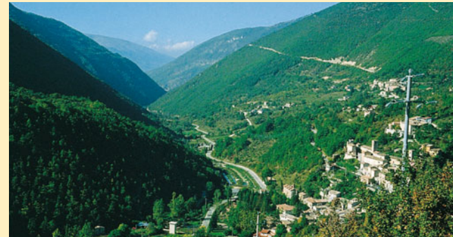
Valle a V; Appennino; fiume