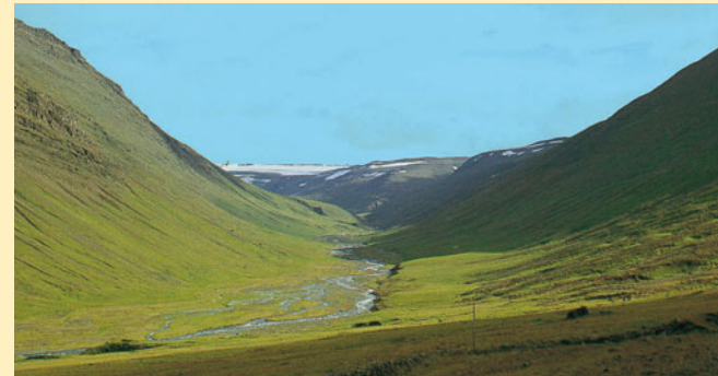
Valle a U; Norvegia; montagne antiche